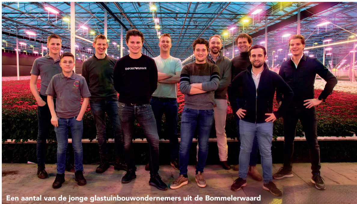
Een aantal van de jonge glastuinbouwondernemers uit de Bommelerwaard

Een nieuw jaar is aangebroken en daarmee bliken wij terug op 2023. Een jaar waar wij als Bommelerwaardse glastuinbouwondernemers met een trots gevoel op terug kijken. Ook in 2023 mochten wij mensen blij maken met een kleurrijk boeket, een groene kamerplant en heerlijke groenten en fruit. Daar zijn wij ontzettend dankbaar voor.