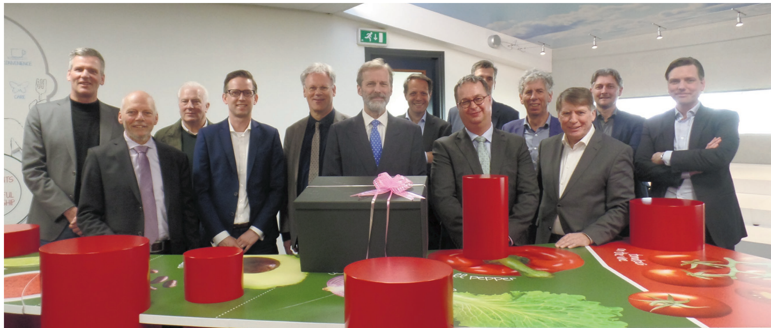
Betrokken partijen WSW bieden getekende intentieverklaringen aan voor minster Wiebes.