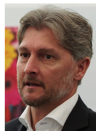
Rotterdam Den Haag en de provincie Jacco Vooijs Foto: GW Zuid-Holland werkt het ROV Zuid-Holland aan het vergroten van de verkeersveiligheid. Onder de noemer 'Maak een punt van nul' is het doel om verkeersveilig gedrag tot norm te maken en het aantal vermeijdbare verkeersslachtoffers terug te brengen naar nul. Doe jij ook mee? Samen maken we een punt van nul verkeersslachtoffers: www.maakeenpuntvannull.nl.

ROV Zuid-Holland: nul verkeersslachtoffers Het Regionaal Ondersteuningsbureau (ROV) Zuid-Holland is trekker van de aanpak 'Maak een punt van nul'. In opdracht van de Metropoolregio