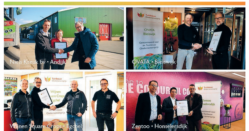
De genomineerden voor de prijs Robotisering en datagedreven tuinbouw.