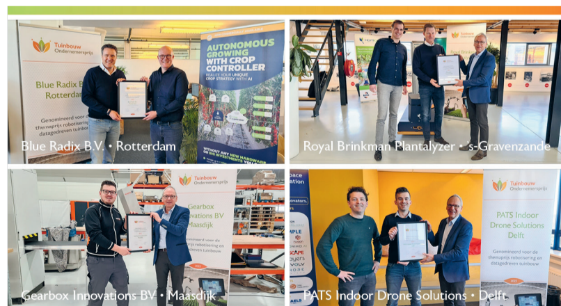
De finalisten voor de Tuinbouw Ondernemersprijs 2022.

De winnaars worden op de Floriade op 21 april bekendgemaakt door minister Henk Staghouwer, sinds begin dit jaar de nieuwe minister van Landbouw, Natuur en Voedselkwaliteit.