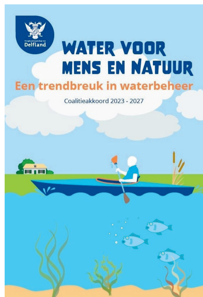
■ Coalitieakkoord 2023-2027.

Het zuiveren van effluent tot oppervlaktewater is wat Glastuinbouw Nederland betreft ook een zogeheten no-regret-maatregel. Behalve onderzoek hiernaar wordt gehoopt dat Delfland in deze bestuursperiode ook komt tot plannen voor uitvoering.