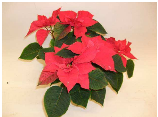
77 Mars Improved