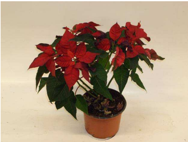
35 LAZZ 1054