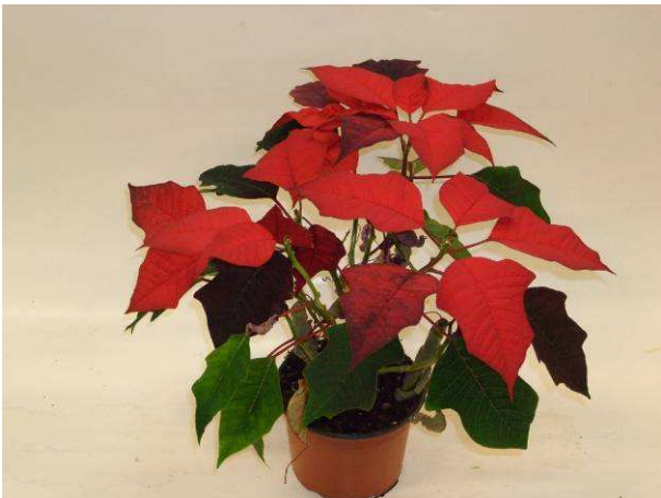
43 LAZZ 1050