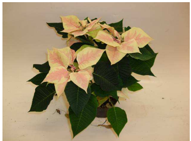
86 Saturnus Marble