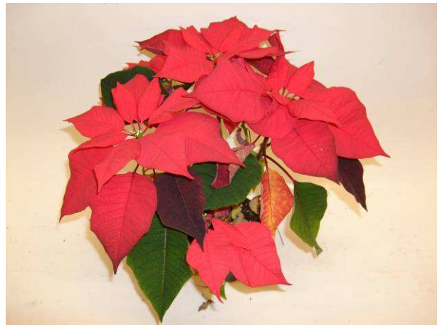
80 LAZZ 1050