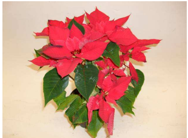
68 Mars Improved (nr 2)