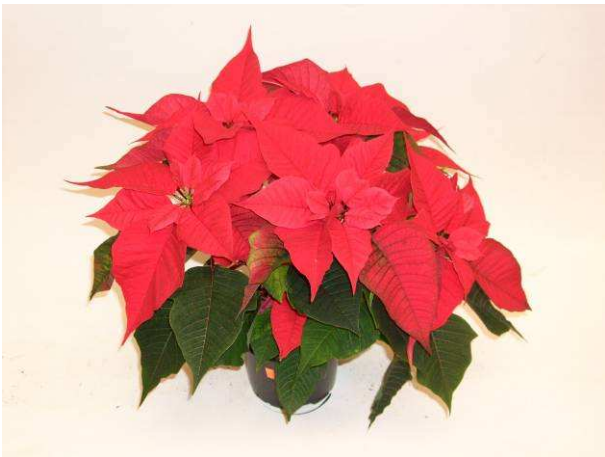
12 Christmas Feelings