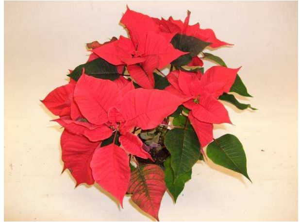
81 Cosmo Red