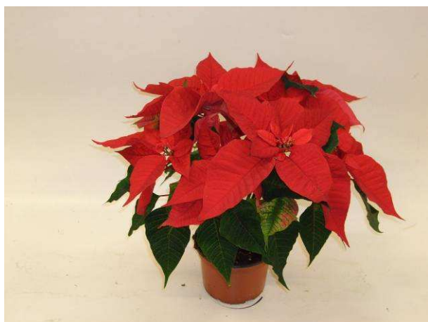
39 Christmas Feelings