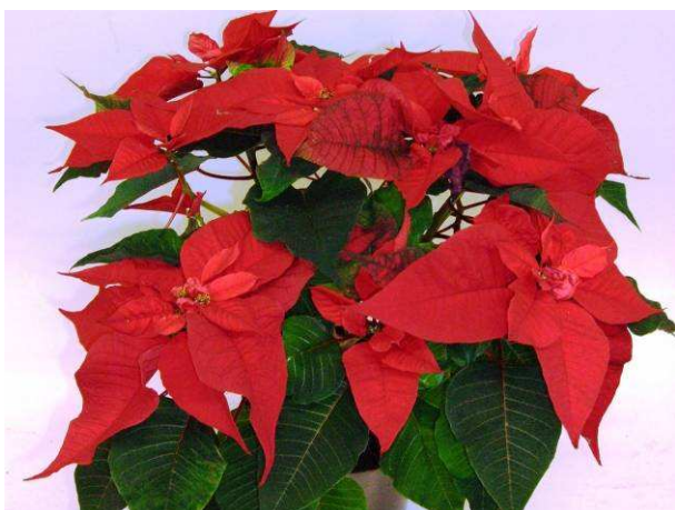
7 Christmas Feelings