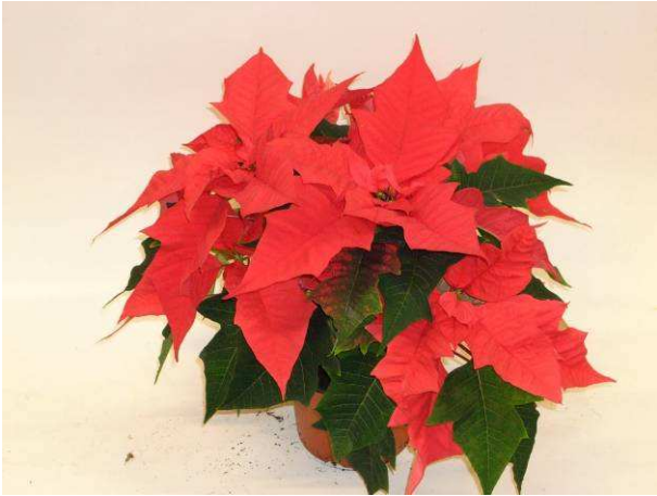
29 Mira Red