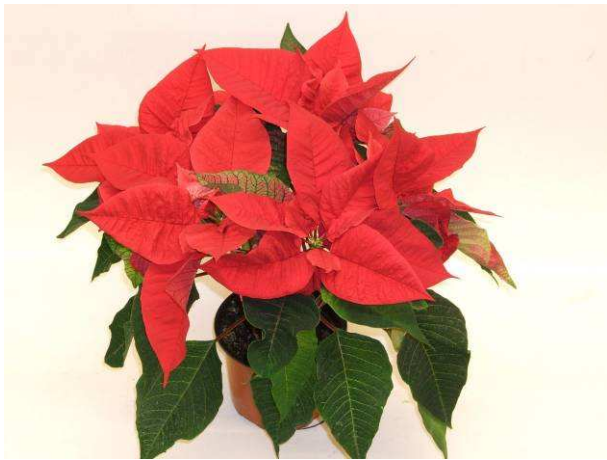
3 premium Red