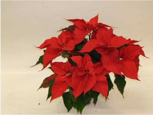
27 Christmas Feelings