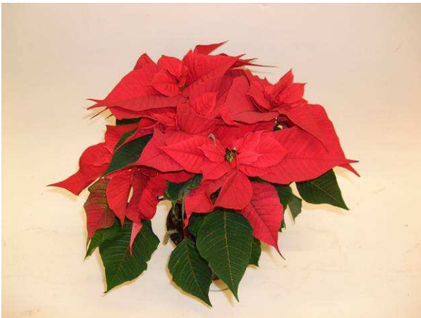
71 Christmas Feelings