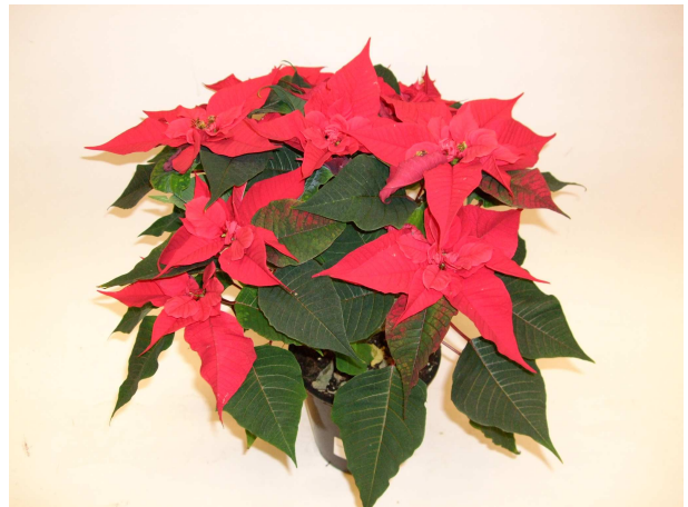
62 Christmas Feelings