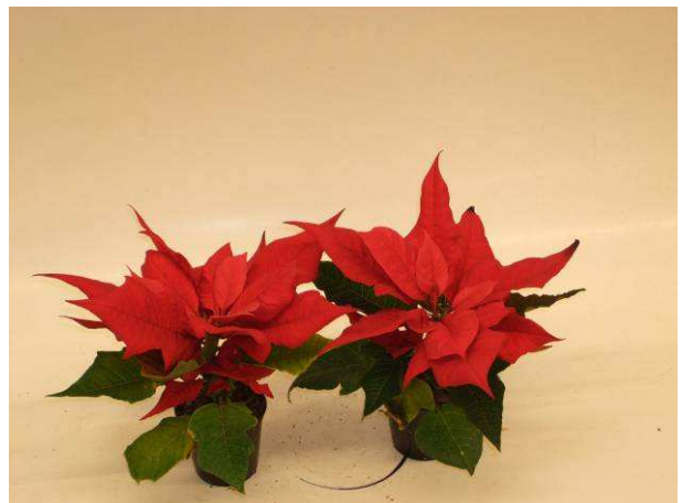
6 Red Elf