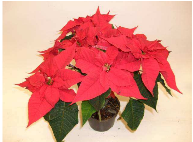
66 Christmas Feelings