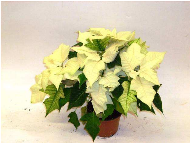
33 Mira White