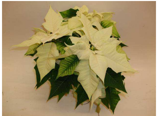
75 Mira White