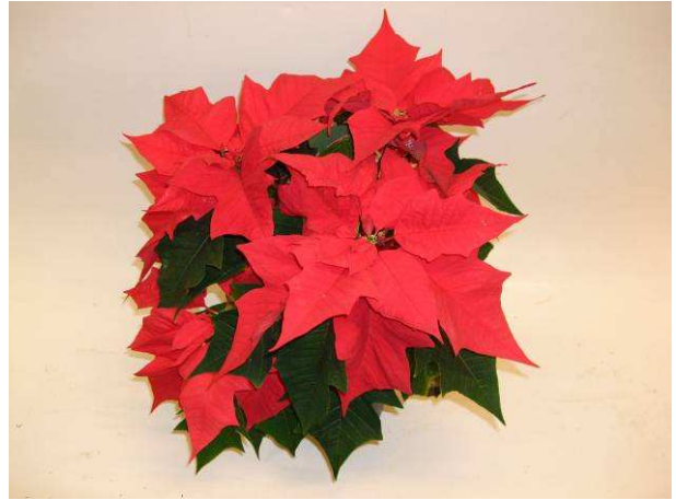
73 Mira Red