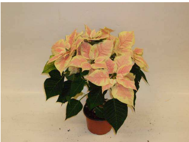
48 Saturnus Marble