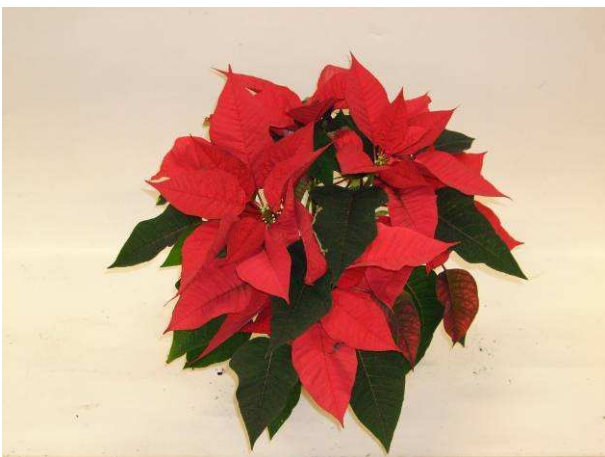
46 SK 64