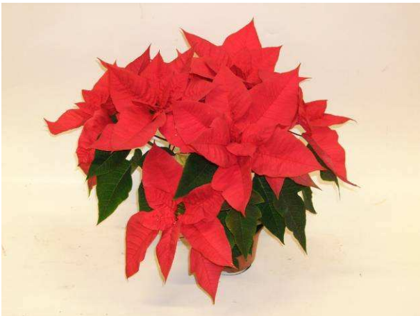
36 Red Dark Green