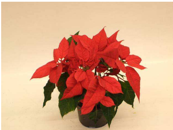
5 Christmas Feelings