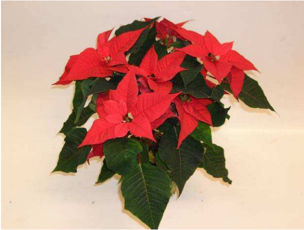
9 Christmas Feelings