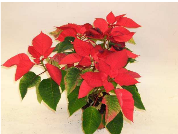
32 Mars Improved