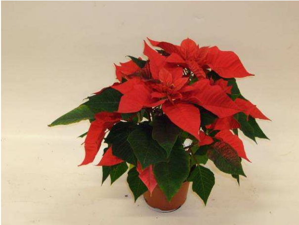
38 RF 2416