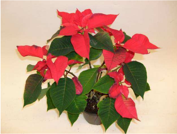
69 Mars Improved (nr 3)