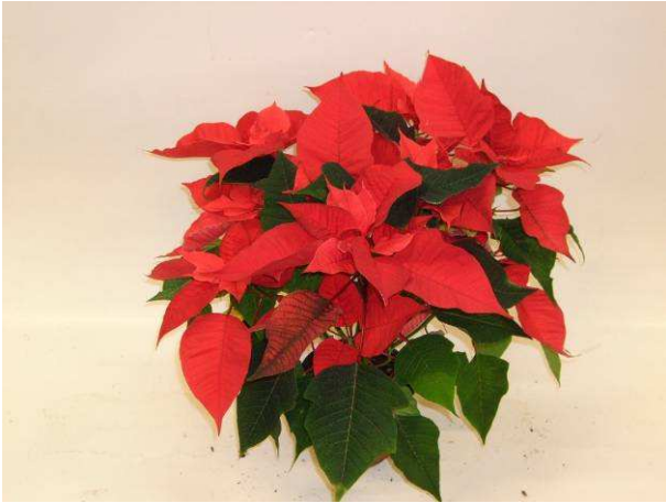
49 Cosmo Red