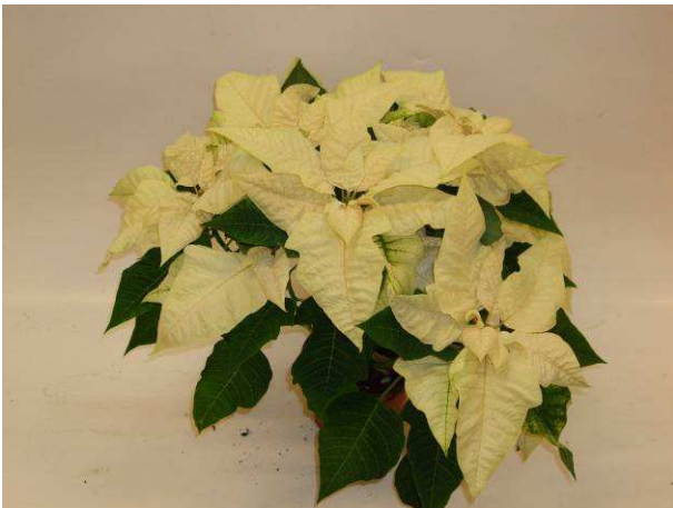
47 Estrella White