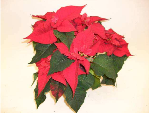
63 Christmas Feelings Allegra