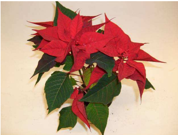
65 Christmas Feeling Merlot