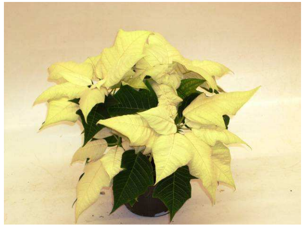
4 Mira White