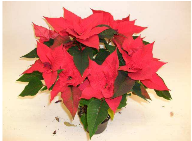
90 Red Dark Green