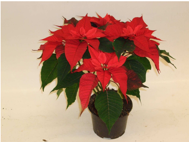
53 Christmas Feelings