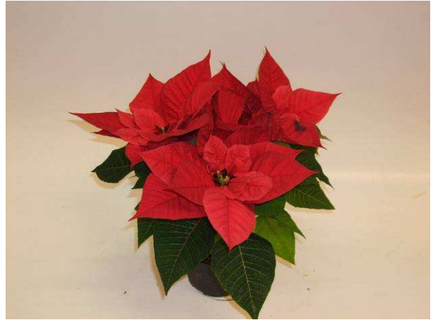
10 Euro Glory