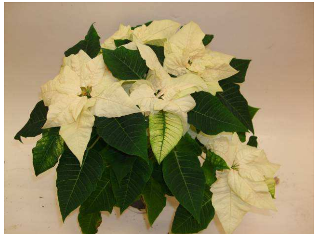
93 Estrella White