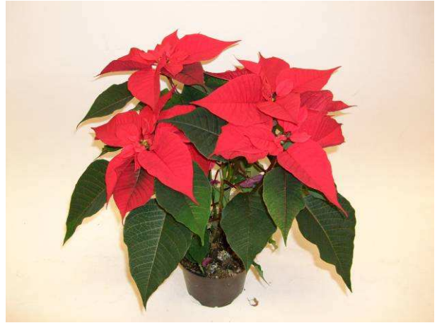
58 Christmas Feelings