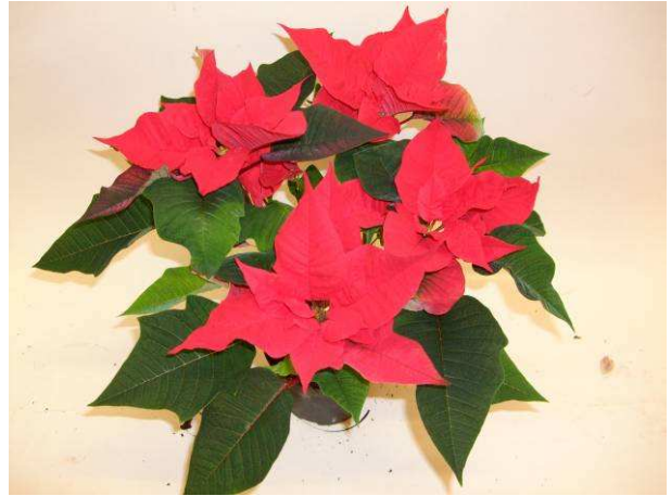
91 SK 67