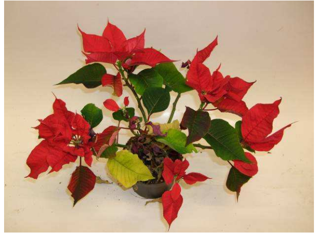
85 LAZZ 1052