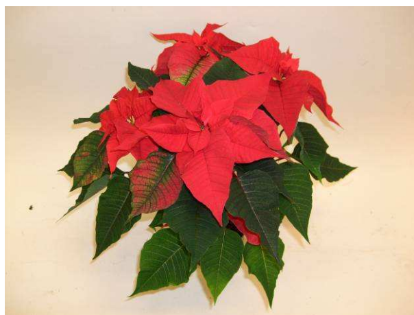
78 Christmas Feelings