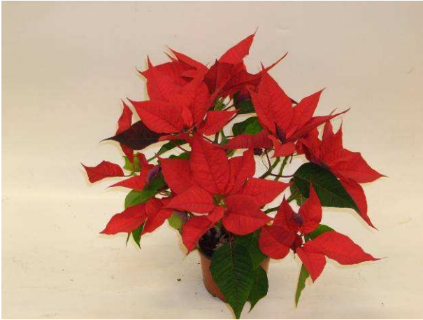
40 LAZZ 1052