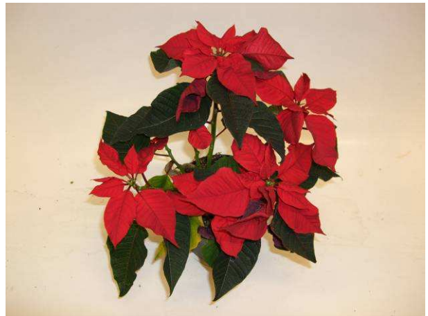
79 LAZZ 1054