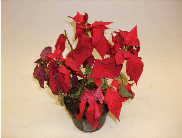
57 Viking Red