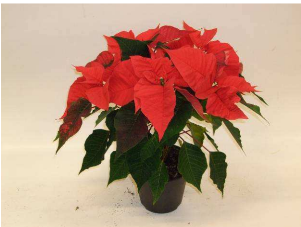
25 Christmas Feelings