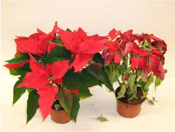
44 SK 67