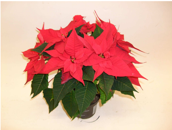
55 Christmas Feelings