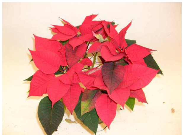
89 SK 64