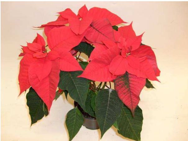
67 Christmas Feelings