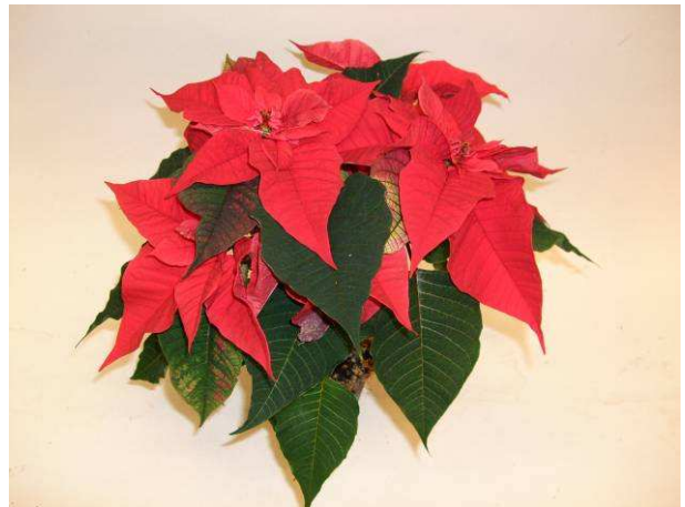
72 Christmas Feelings