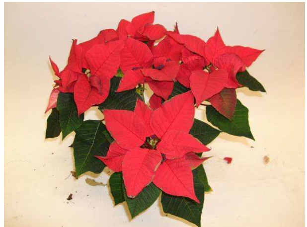
92 Saturnus Red