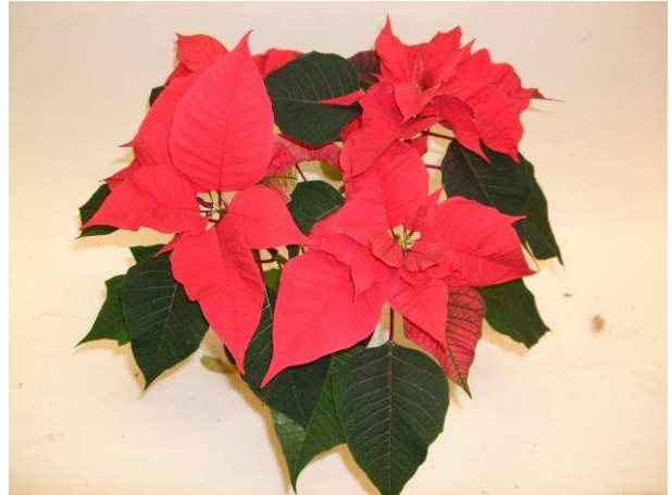
87 RF 2416