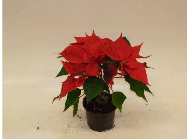
28 Christmas Feelings