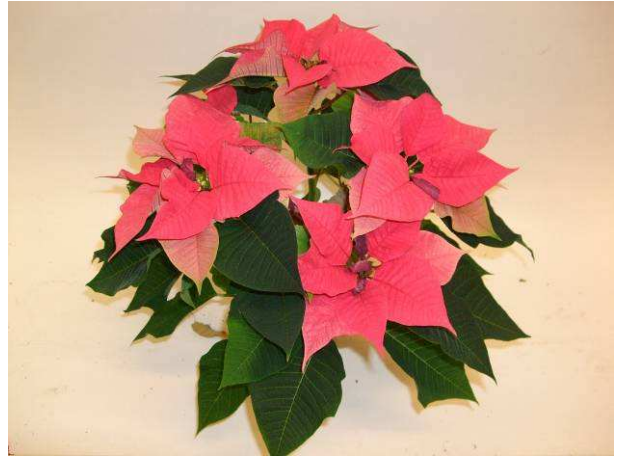
82 Saturnus Pink