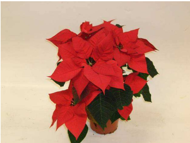
41 Saturnus Red