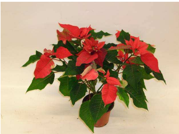
37 RF 7336