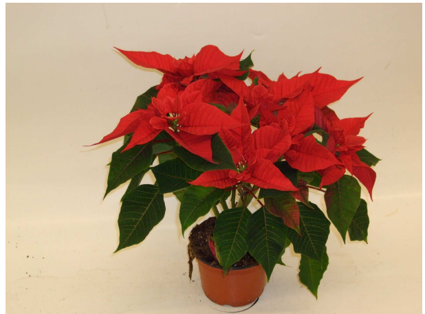
54 Christmas Feelings