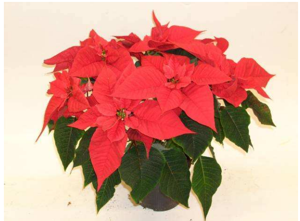
24 Christmas Feelings