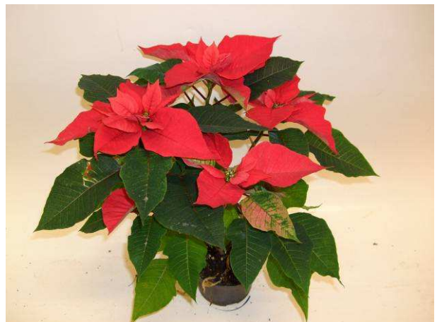
84 RF 7336