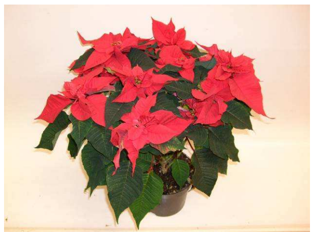
8 Christmas Feelings