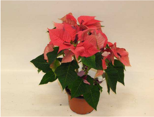
42 Saturnus Pink