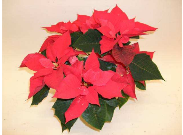
70 Mars Improved (nr 10)