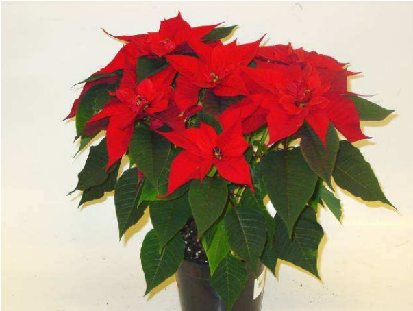
49 Christmas Feelings