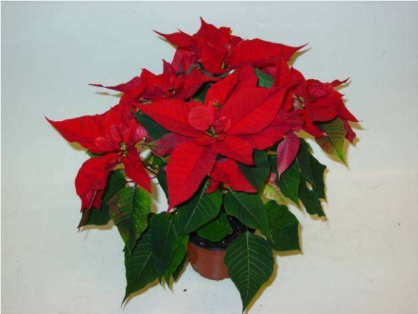
85 Christmas Feelings