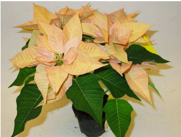
12 Exp. Cinnamon