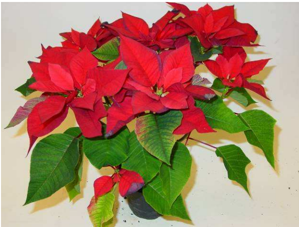
15 Mars early red