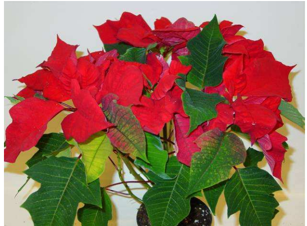
62 PLA Ecks Point Jubilee