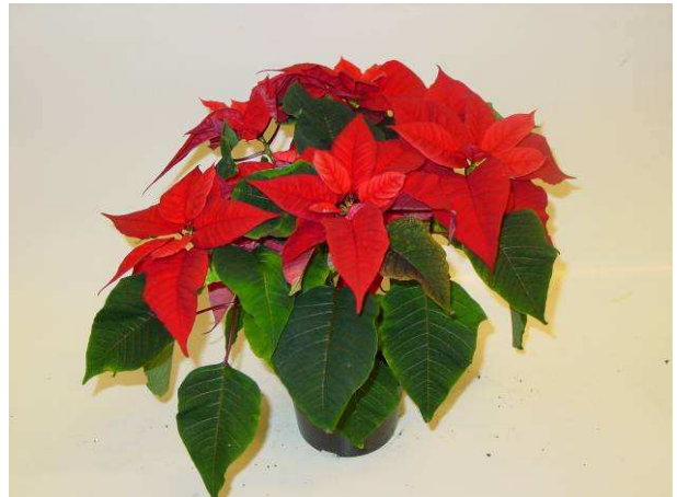
44 Christmas Feelings Merlot