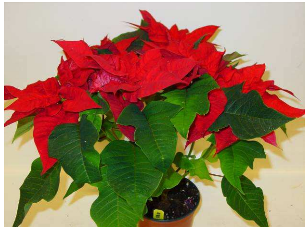
53 Mars early red