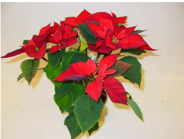
6 Mars Improved