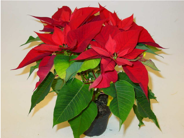
10 LAZZ 1064