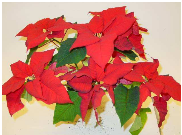
69 LAZZ 1067