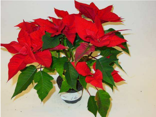
16 Titan Red