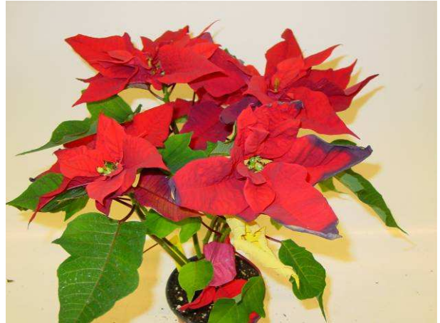
66 RF 5969