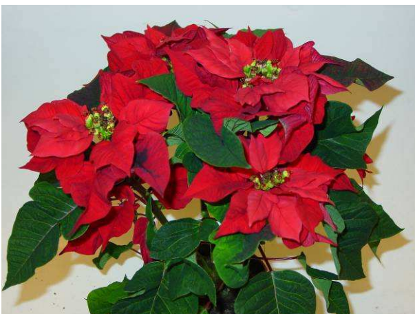
21 Saturnus Twist