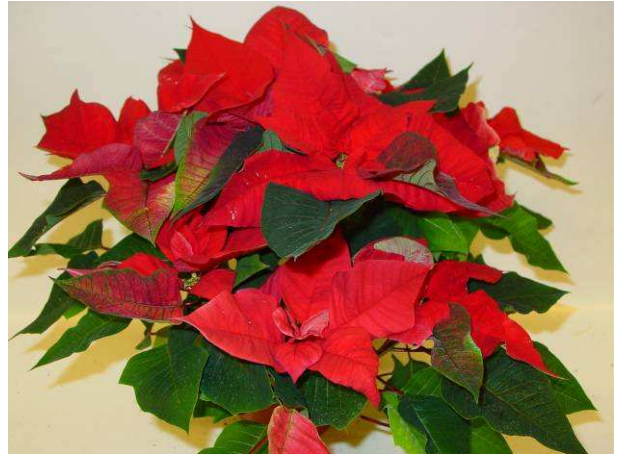
70 Lazz Allegra