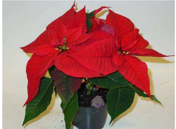
73 Christmas Feelings