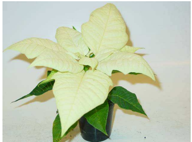
76 Mira white