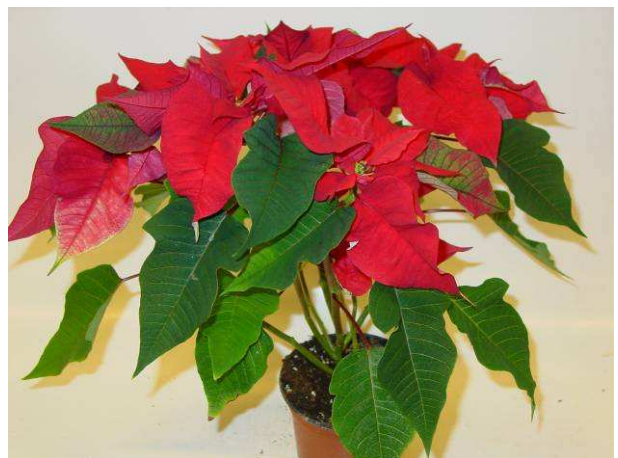
56 RF 2862