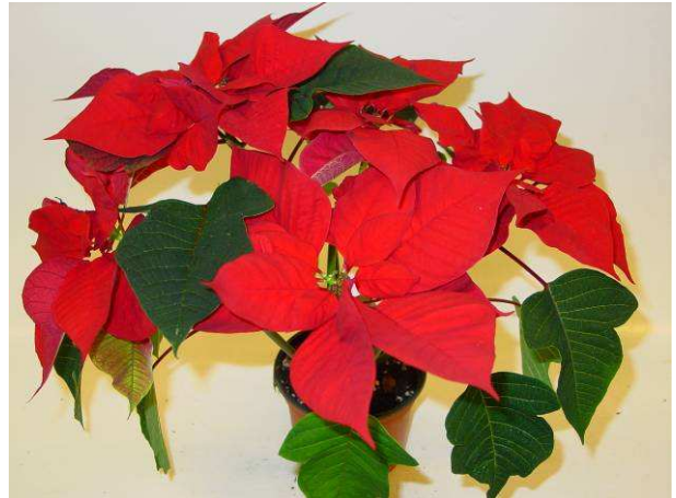
55 Saturnus red