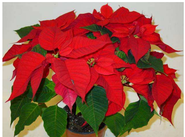
61 Christmas Feelings