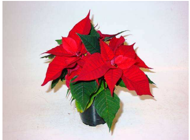
80 Christmas Feelings