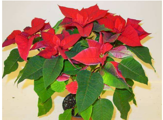
68 LAZZ 1066