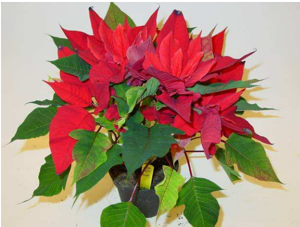
24 RF 148