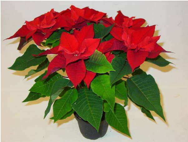
8 LAZZ 1066