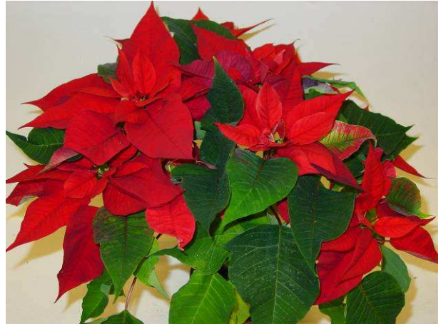
64 LAZZ 1064