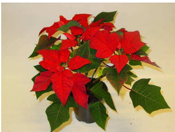
41 Estrella red