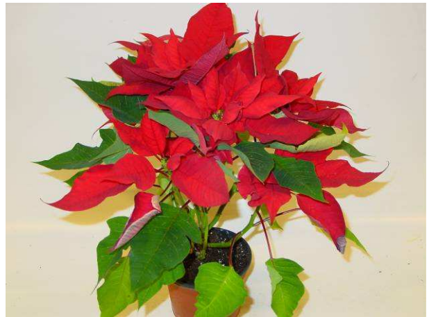
54 RF 148