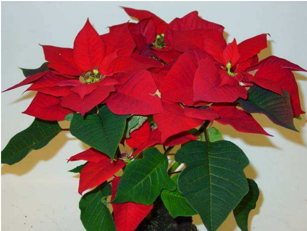
22 Saturnus red