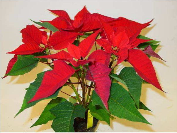
25 SK 81