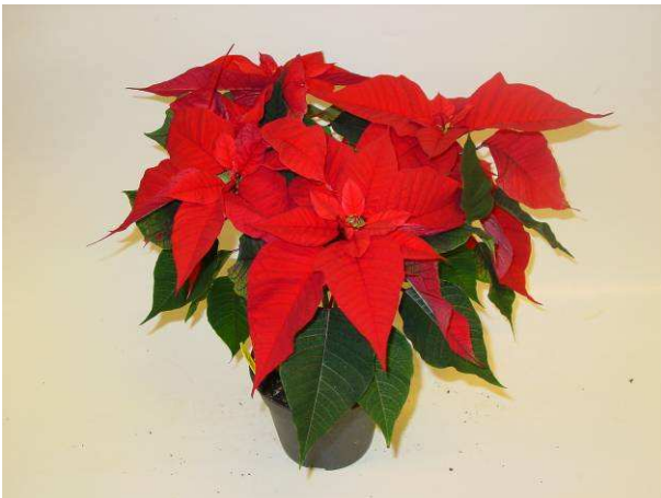
45 Christmas Feelings