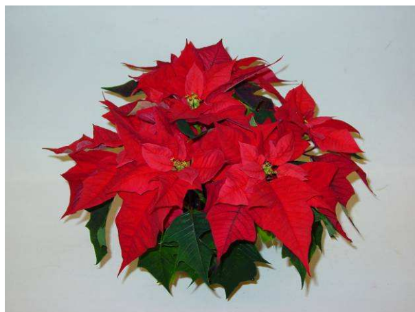
2 Mira red