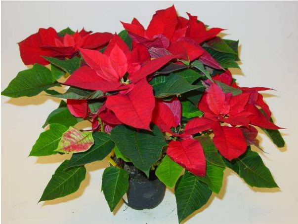
11 Lazz Allegra