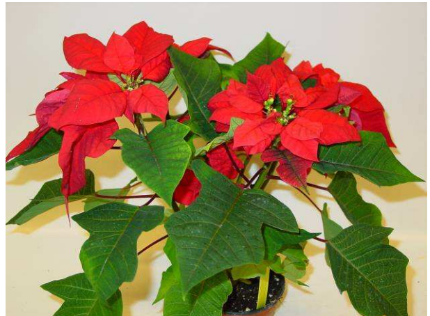
57 Estrella red