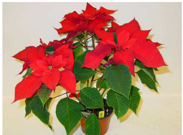
50 Mars Improved