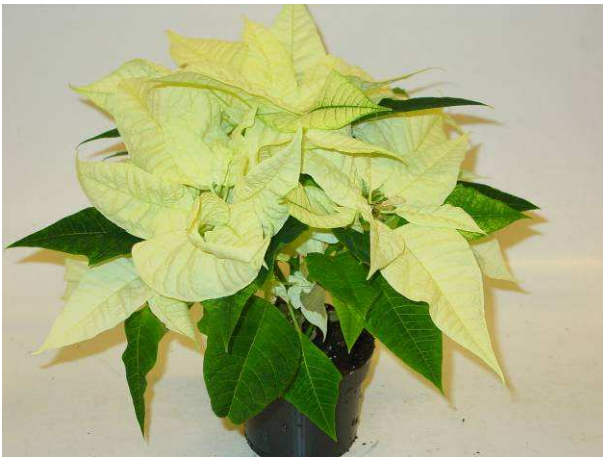
74 Christmas Feelings white