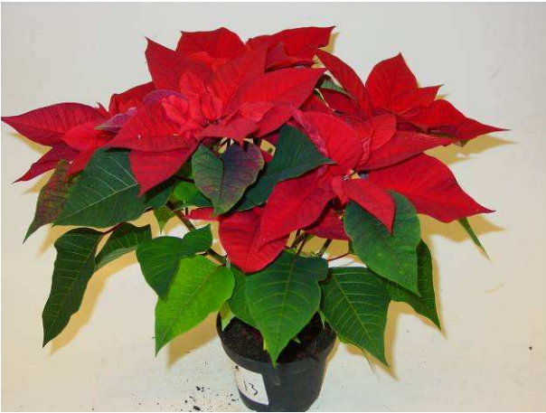
13 Viking red