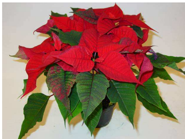
4 Christmas Feelings