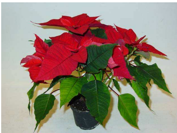
1 Christmas Feelings