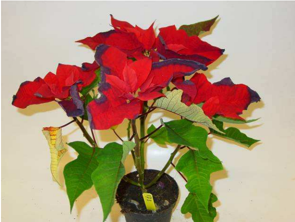
17 RF 5969