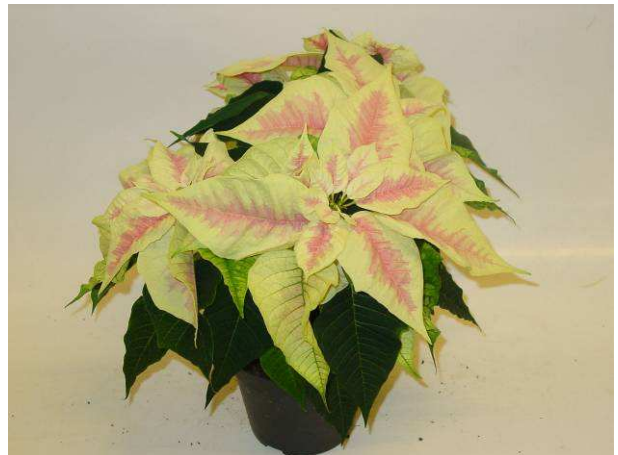
46 Christmas Feelings Marble