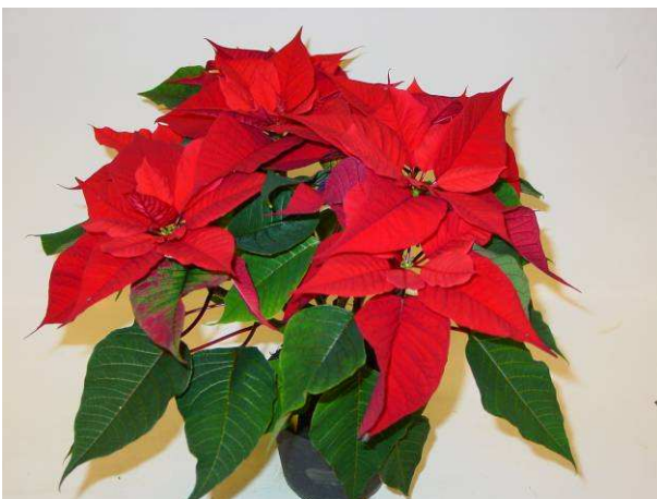
7 Christmas Feelings