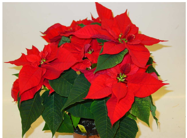
52 Happy Christmas vol SK 70