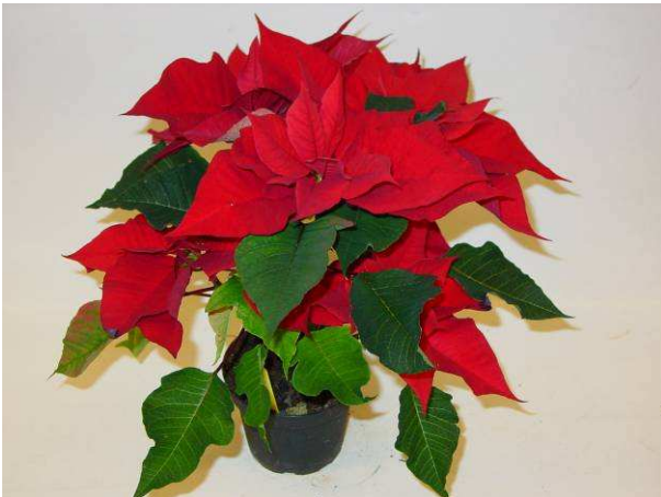
9 Prestige Early red