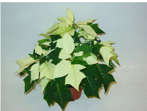
83 Christallo white