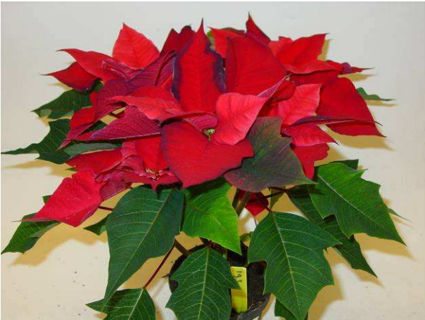
19 PLA Ecks Point Jubilee