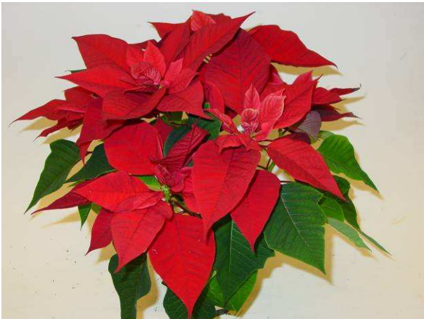
20 Estrella red