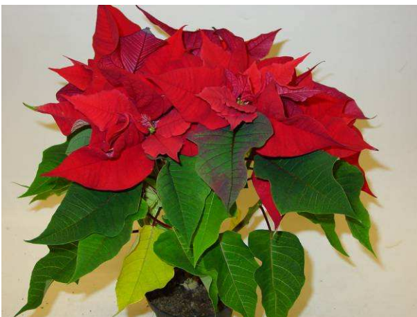
18 RF 2862