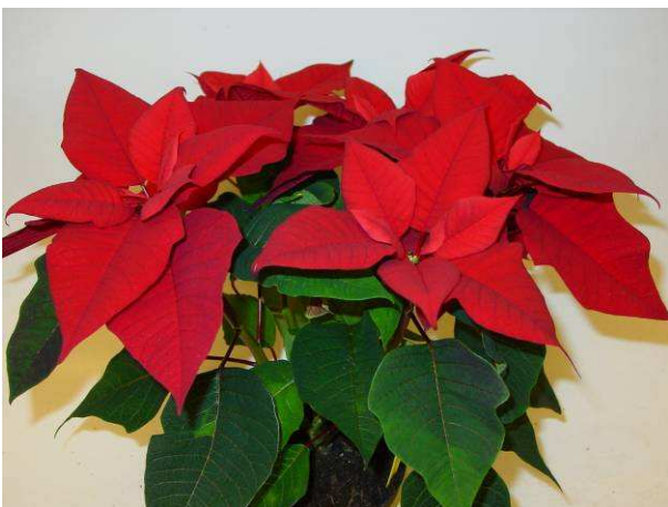
26 LAZZ 1067