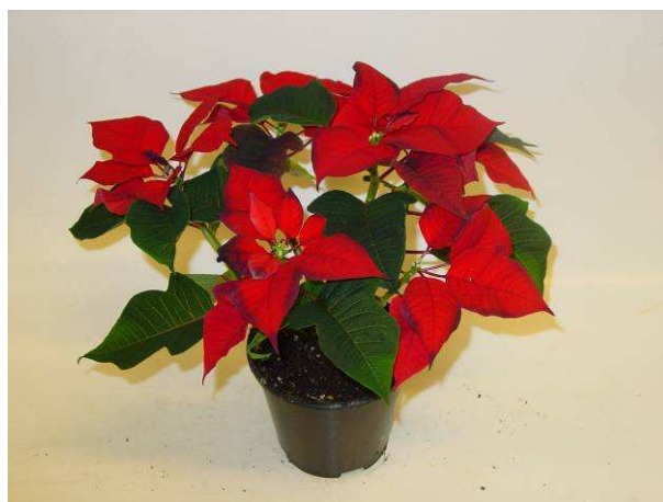
42 Saturnus red