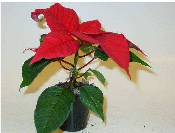
77 Christmas Feelings