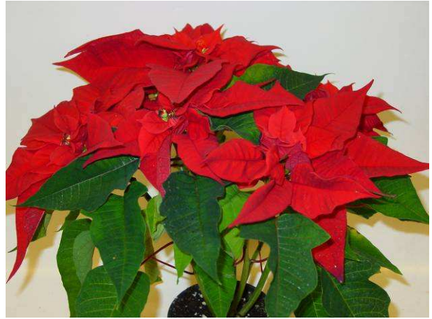
63 SK 81