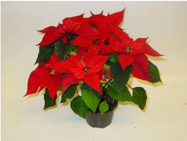
43 Christmas Feelings