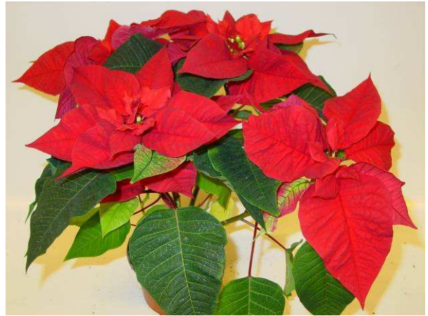
67 Viking red