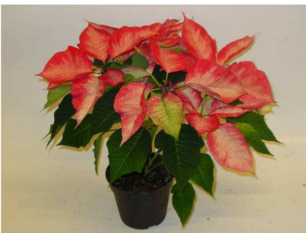
47 Premium Ice Crystal