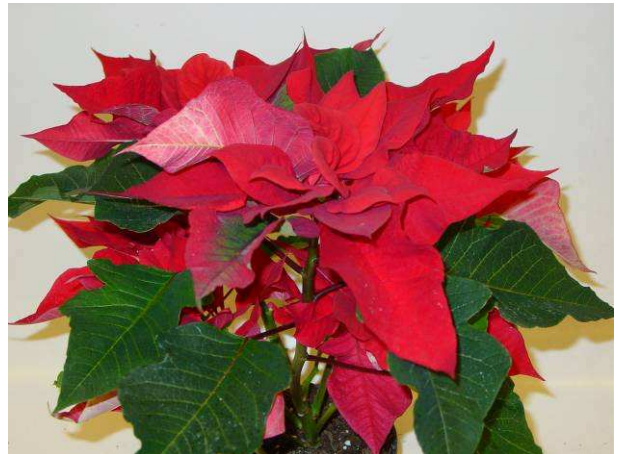
60 Prestige Early red