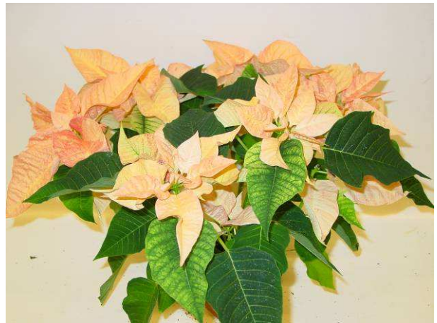
71 Exp. Cinnamon