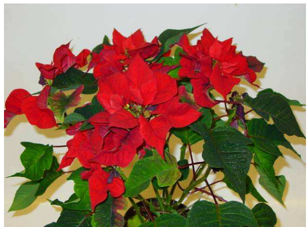
59 Saturnus Twist