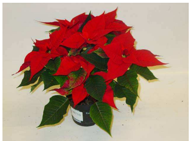
48 Christmas Feelings