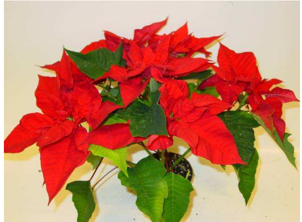
65 Titan Red