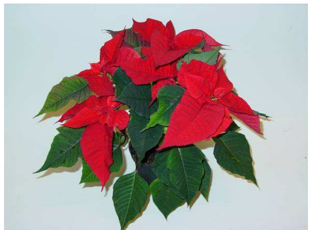
78 Christmas Feelings