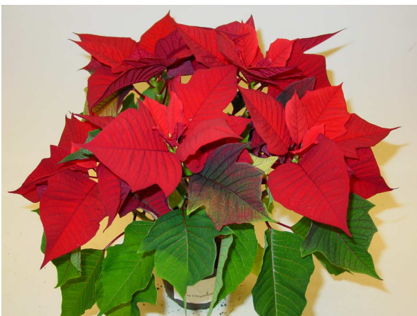
23 Happy Christmas vol SK 70