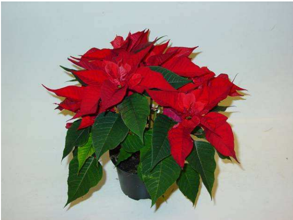
79 Christmas Feelings