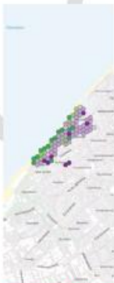
Westduinpark & Wapendal