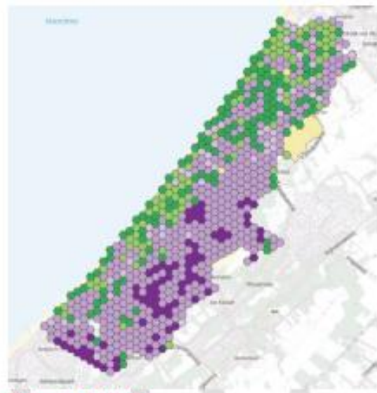
Meijndel & Berkheide