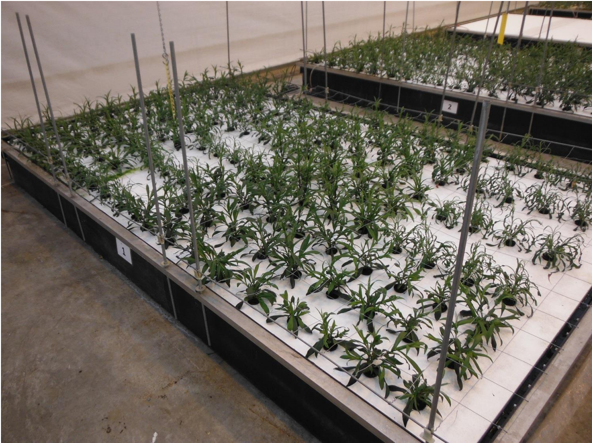
Figuur 1: Diverse cultivars Asters op water, 3 weken na planten