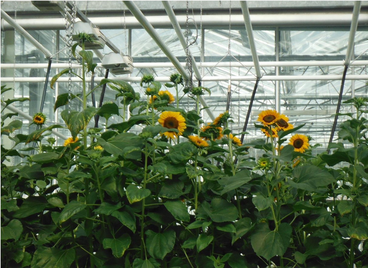
Figuur 6: De Zonnebloemen werden zeer lang