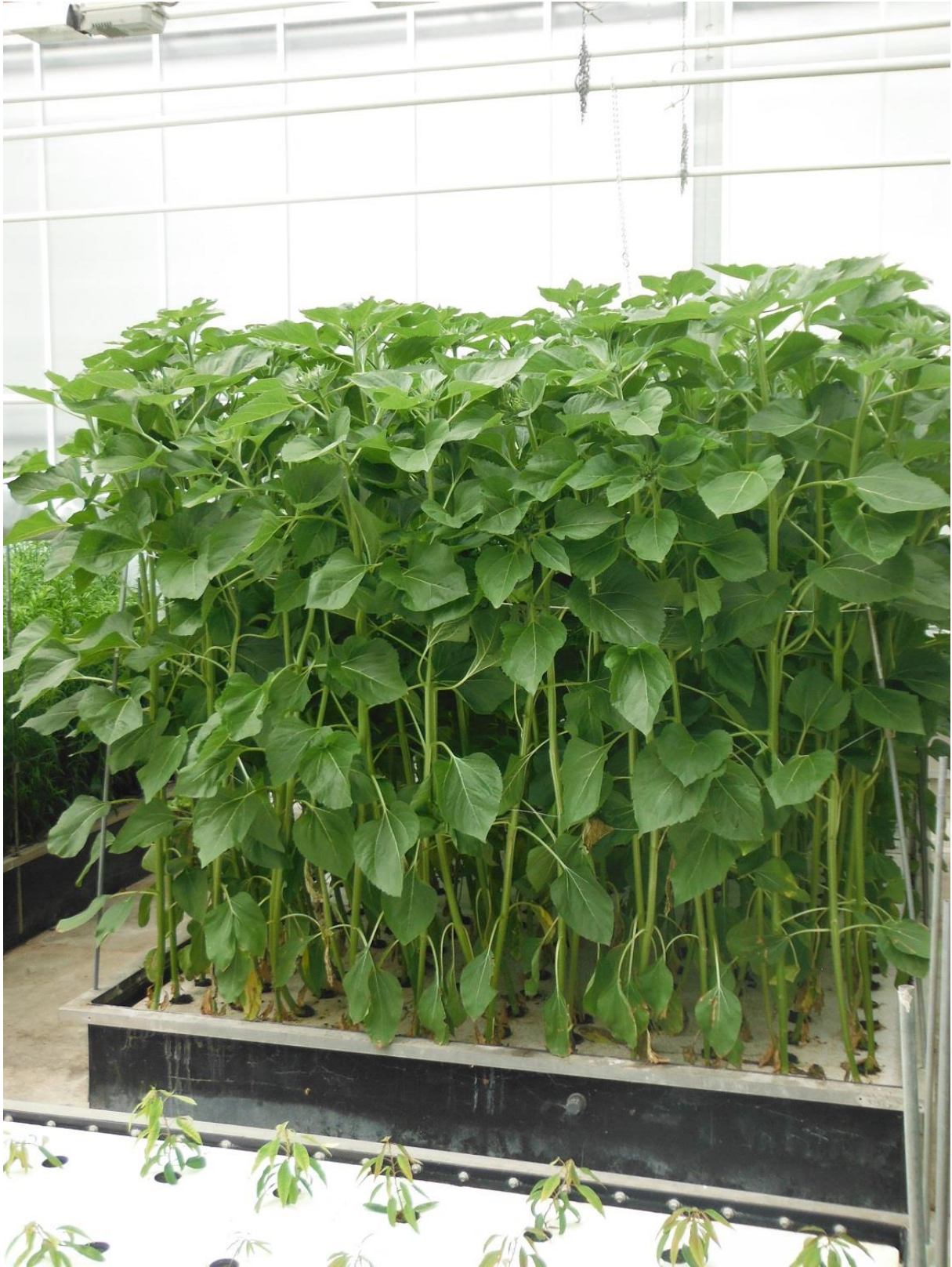
Figuur 5: Zonnebloemen in ontwikkeling