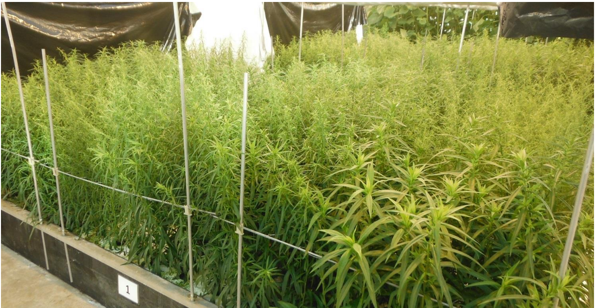
Figuur 2: Diverse cultivars Asters op water