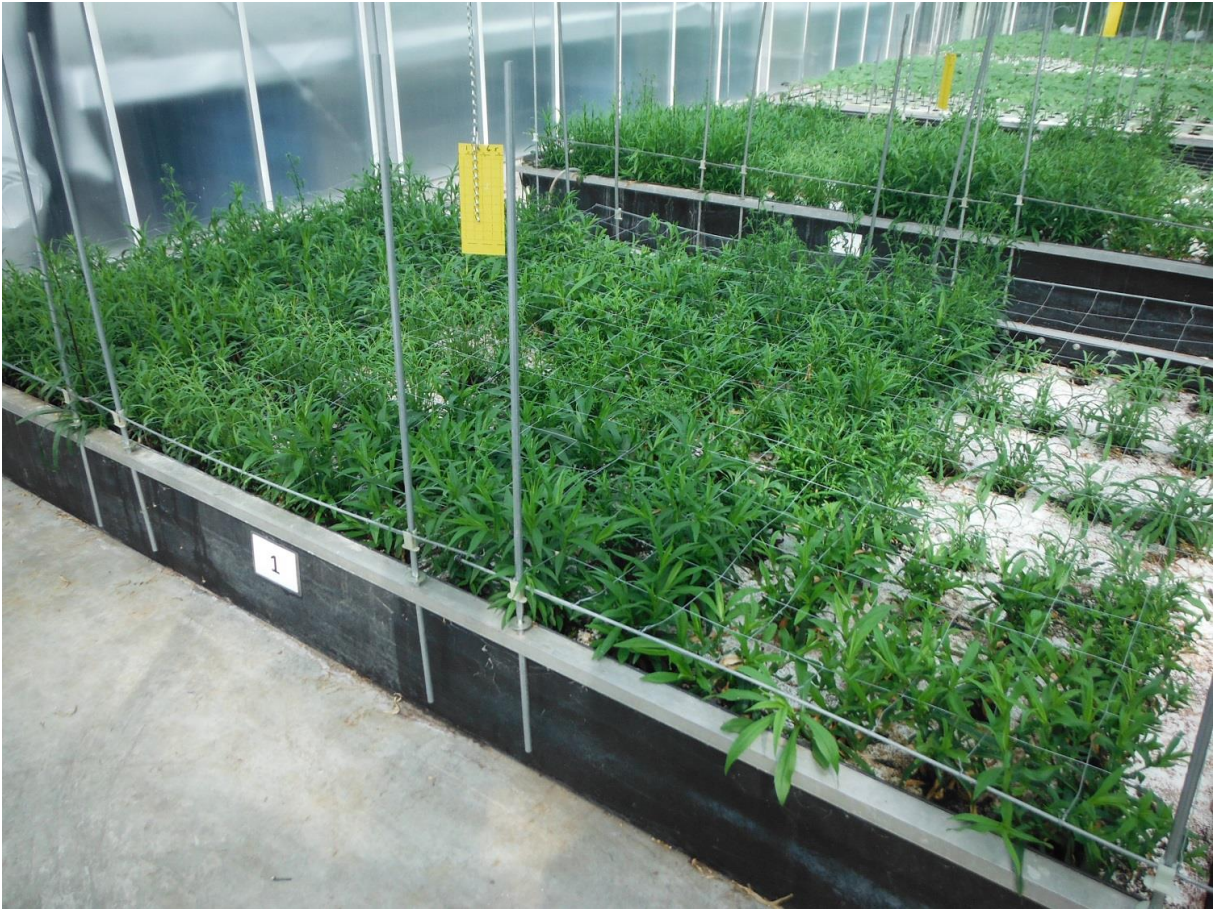
Figuur 3: Diverse cultivars Asters op water 2 e snee in ontwikkeling