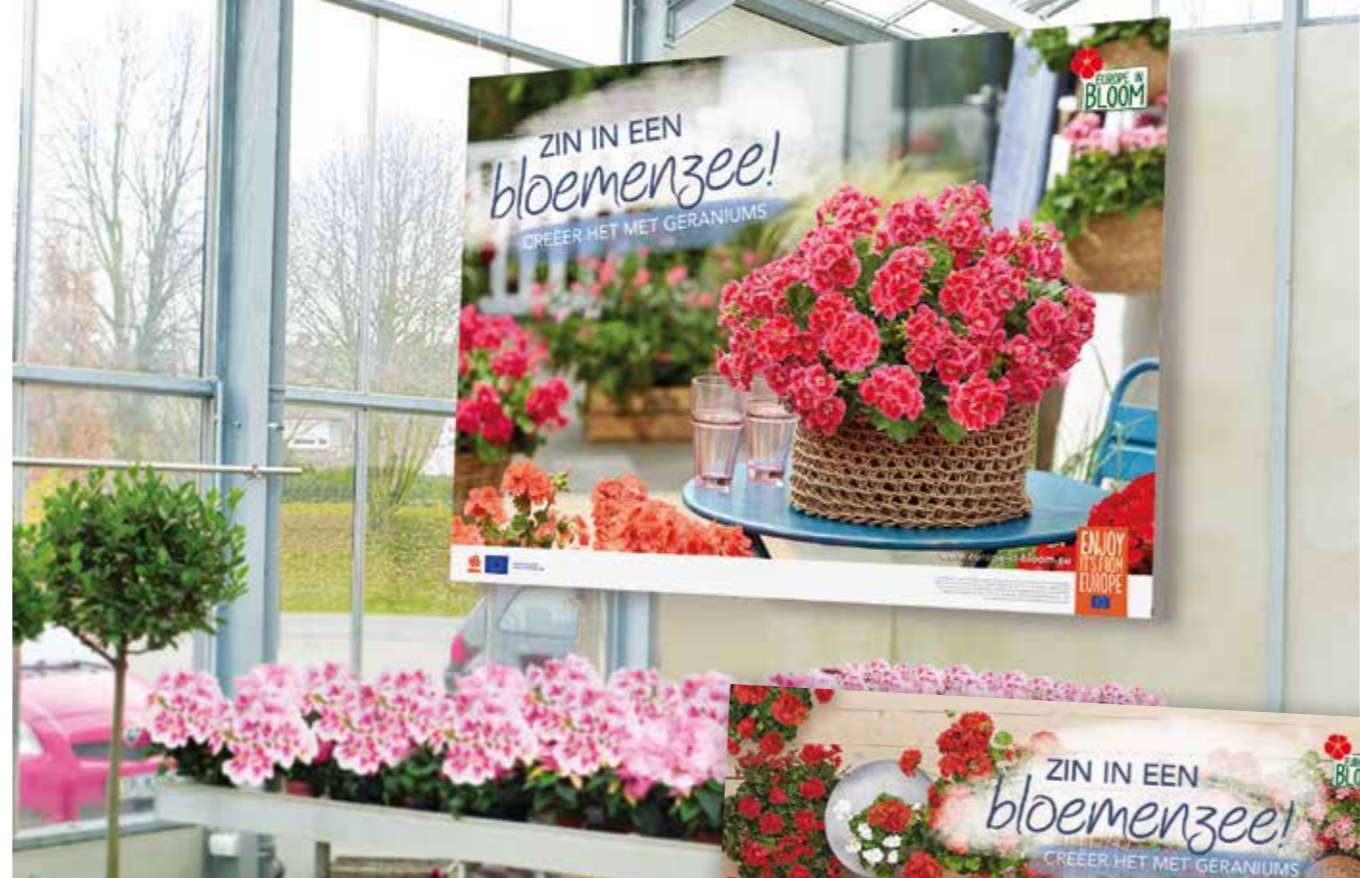
Afbeelding „Kom tot bloei!“ (Afbeelding toont grootteverhouding XXL-banners.)

Formaat: DIN lang, past daarmee optimaal in klassieke flyer displays.