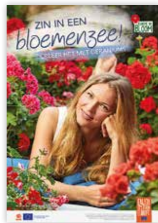
Afbeelding „Lekker chillen!“