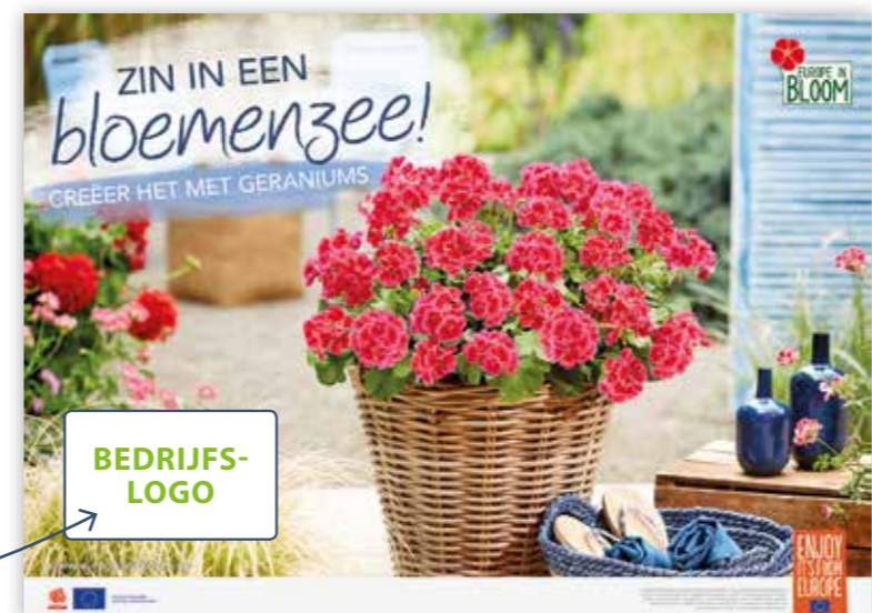
Afbeelding „Cool down!“

Bedrijfslogo, kleur, linksonder: eenmalig € 80*